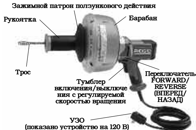
Рис. 1 – Инструмент для чистки канализации К-45 с зажимным патроном ползункового действия

Перечень выпускаемых тросов с указанием их длины приведен в разделе "Дополнительные принадлежности"