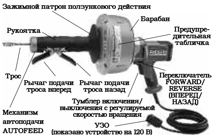
Рис. 2 – Инструмент для чистки канализации К-45 AF с автоподачей AUTOFEED