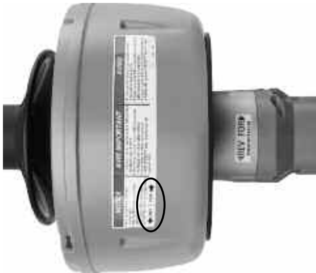
Рис. 5 – Этикетки ВПЕРЕД/НАЗАД (FOR/REV)

8. Не нажимайте рычаги подачи инструмента (только на инструментах с автоподачей AUTOFEED). Нажмите тумблер включения питания (ON/OFF) и определите направление вращения барабана по сравнению со стрелками ВПЕРЕД/НАЗАД (FOR/REV) на наклейках. Если тумблер выключения питания (ON/OFF) не управляет работой инструмента, не используйте инструмент для чистки канализации до тех пор, пока тумблер не будет отремонтирован. Отпустите тумблер и дождитесь полной остановки барабана. Переместите переключатель ВПЕРЕД/НАЗАД (FOR/REV) в другое положение, и повторите описанную выше процедуру проверки правильности вращения инструмента для чистки канализации в обратном направлении.