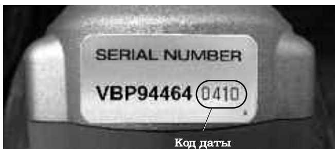
Рис. 3 – Серийный номер инструмента

Серийный номер электроинструмента указан снизу на его корпусе. Последние 4 цифры обозначают месяц и год его выпуска. (04 = месяц, 10 = год).