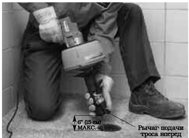
Рис. 10 – Автоматическая подача троса в режиме AUTOFEED

Проверьте, что трос на длину не менее 30 см (12") введен в канализационную трубу, а выход троса из инструмента для чистки канализации располагается на расстоянии не более 30 см (6") от входного отверстия канализационной трубы. Переместите рукоятку в сторону от барабана, чтобы освободить трос в зажимном патроне. Запрещается включать зажимной патрон в режиме автоподачи AUTOFEED. Для пуска инструмента включите тумблер электропитания ON/OFF. Чтобы переместить трос вперед в канализационную трубу, нажмите рычаг подачи вперед. Вращающийся трос начнет поступать в канализационную трубу. Не следует допускать накручивания, изгиба или искривления троса перед входным отверстием канализационной трубы. Это может привести к перекручиванию, перегибу или обрыву троса.