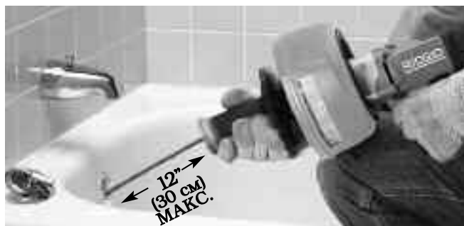
Рис. 8 – Переместите рукоятку в сторону к барабану, чтобы зажать трос зажимным патроном

Если подача кабеля вперед затрудняется, для улучшения захвата и подачи троса можно использовать зажимной патрон. Переместите рукоятку в сторону к барабану, чтобы зажать трос в зажимном патроне. Во время вращения троса (тумблер ON/OFF включен в положение ON) переместите инструмент для чистки канализации к входному отверстию канализационной трубы, чтобы протолкнуть трос внутрь. Отпустите тумблер включения-выключения питания (ON/OFF). Переместите рукоятку в сторону от барабана, чтобы освободить трос в зажимном патроне. Рукой, на которой надета рукавица, захватите трос во избежание его выскакивания наружу из канализационной трубы и переместите инструмент для чистки канализации назад так, чтобы на воздухе находилось не более 12" (30 см) троса. Повторяйте вышеуказанные операции, продолжая таким образом перемещать трос вперед. (См. рис. 8-9.)