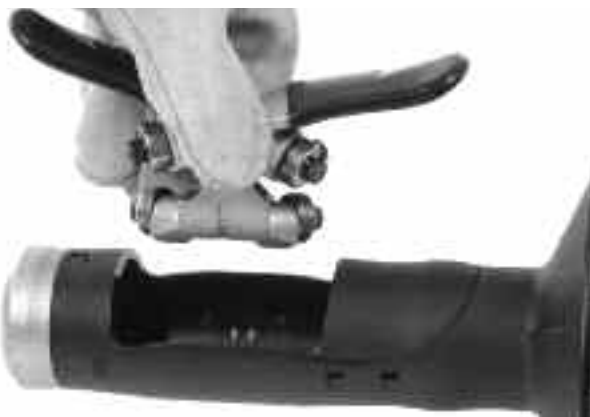
Рис. 12B – Снятие механизма автоподачи AUTOFEED с корпуса