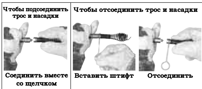
Рис. 7 – Подсоединение и отсоединение насадок

При использовании удлинительного шнура питания следует учитывать, что УЗО в инструменте для чистки канализации не обеспечивает защиту для удлинительного шнура. Если электрическая розетка не оборудована УЗО, рекомендуется использовать вилку с защитой УЗО между розеткой и удлинительным шнуром питания, чтобы снизить опасность поражения электрическим током в случае неисправности удлинительного шнура.