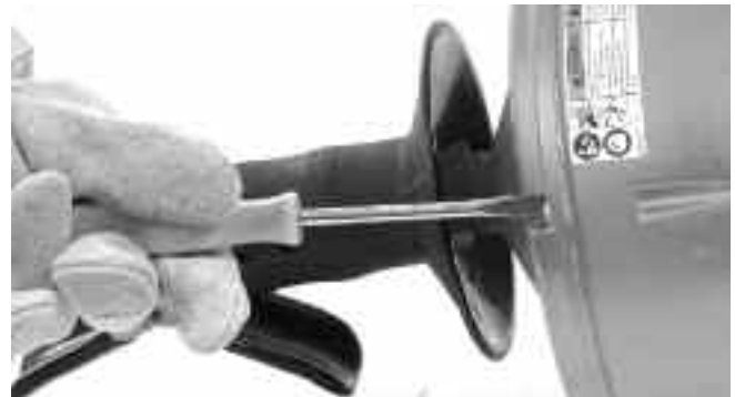
Рис. 13 – Слегка отверните 4 винта барабана примерно на 3 полных оборота, но не извлекайте их