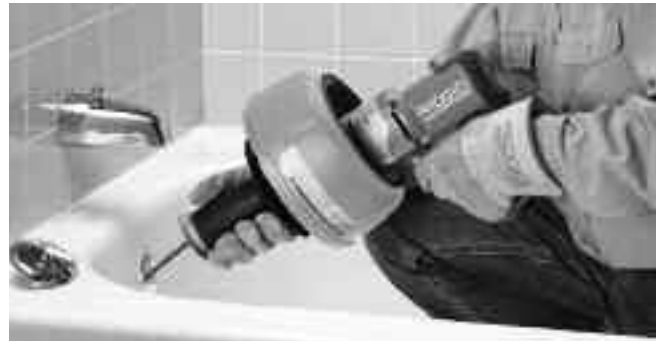
Рис. 9 – Протолкните трос дальше в канализационную трубу